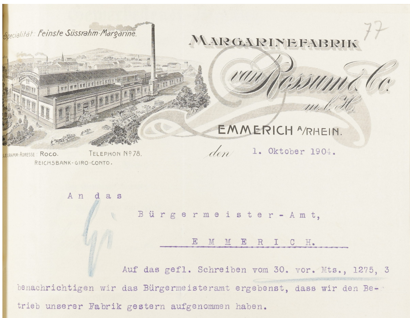
Abb. 4: Schreiben bezüglich der Aufnahme des Betriebs der Margarine Fabrik van Rossum.