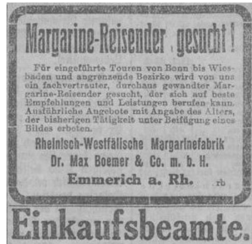
Abb. 1.: Werbeanzeige der Rheinisch-Westfälische Margarinefabrik Dr. Max Boemer & Co. mbH.

„Margarine Reisender gesucht!“ Mit dieser Anzeige versuchte die Rheinisch-Westfälische Margarinefabrik Dr. Max Boemer & Co. G.m.b.H. vor 100 Jahren einen fähigen Handelsvertreter anzuwerben. Im ersten Moment werden sich sicherlich viele Leser über die heute ungewöhnlich anmutende Berufsbezeichnung wundern, dann aber direkt überlegen von welcher Margarinefabrik hier eigentlich die Rede ist. Margarine aus Emmerich, gab es die wirklich?